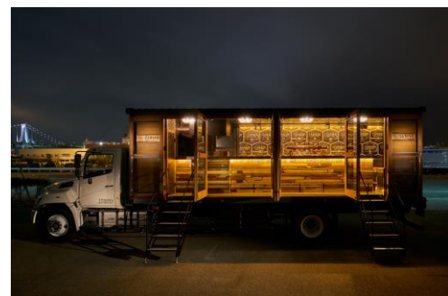
クラフトビアカー「エルカミオン」

天王洲「T. Y. HARBOR」(ティーワイハーバー)など、都内で12店舗を手掛けるタイソズアンドカンパニーの新業態クラフトビアバー「EL CAMION by T. Y. HARBOR BREWERY(エルカミオン)」が出現、インスタグラム映えは間違いなしです。