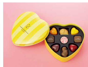
〈ピエール マルコリーニ〉 バレンタイン セレクション(9個入)