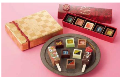
〈ベル アメール 京都別邸〉 スティックショコラアソート(8個入)