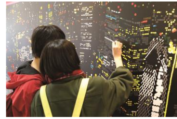
監修: 大村雪乃氏 ※画像は制作イメージです。