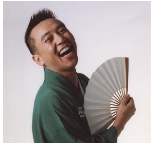
林家たい平さん[落語家]