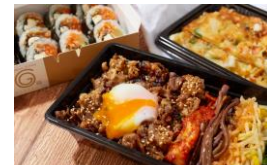
<カンナムデリ> 惣菜/韓国料理