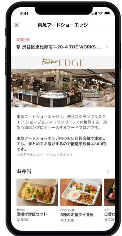
※「Chompy」の画面イメージです。

「東急フードショーエッジ(デリ)」内であれば複数店舗でのご注文も1店舗分の配送料でお届けできるため、ご家族やオフィスの同僚と一緒にさまざまなカテゴリーの料理を気軽に注文できます。