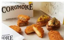
<COROMORE(コロモア)> 惣菜/コロッケ