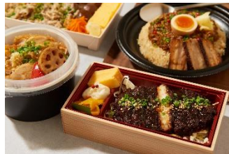
※<寛 rinato(リナト)>のイメージです。

株式会社 東急百貨店(以下、当社)は、株式会社 シン(以下、シン)と協業し、自宅やオフィスから“デパ地下グルメ”をスマートフォンで注文できるデリバリーサービス、8月11日(火)から約3カ月間の予定で試験的に実施します。