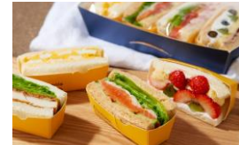
< Boutonia Sandwich (ブートニア サンドイッチ) > ベーカリー / サンドイッチ