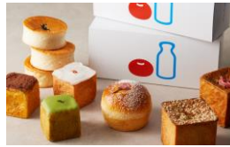
<キムラミルク> ベーカリー/あんぱん・牛乳