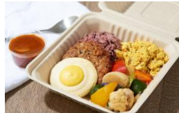
< Peace Cafe Hawaii (ピースカフェ ハワイ) > 惣菜 / ハワイ料理 (ビーガン)