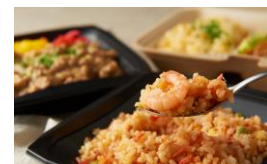
<参和院> 惣菜/台湾料理