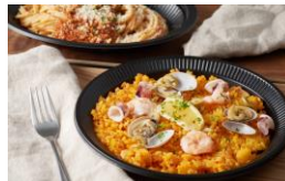
< medite (メディテ) > 惣菜 / 洋食