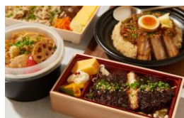
<寛 rinato(リナト)> 惣菜/和洋食