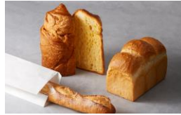
< ティ エ リ ー マ ル ク ス ラ ブ ー ラ ン ジ エ リ ー > ベーカリー