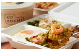
<cocochili(ココチリ)> 惣菜/エスニック