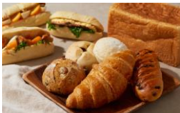
< メ ゾ ン ・ イ チ > ベーカリー