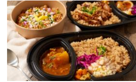
< 寝 か せ 玄 米 と カ レ ー & ス パ イ ス nuka (ヌーカ) > 惣菜 / エスニック