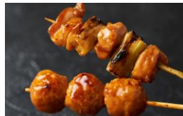
<からあげ家 奥州いわい> 惣菜/からあげ・やきとり ※9月よりサービス開始予定