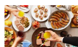
< Les Viandes par Table Ogino (レ ヴィ ア ン ド パ ー タ ー ブ ル オ ギ ノ) > 惣菜 / 洋食