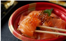
< 華 彩 HANAIRO > 寿司 / 海苔巻き