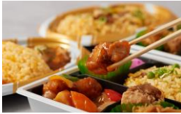
< 謝 謝 チ ャ イ ニ ー ズ キ ッ チ ン > 惣菜 / 中華料理