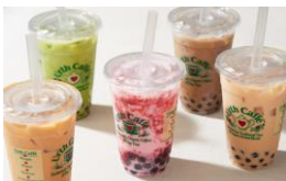
< Urth Caffé (アースカフェ) > コーヒー ※9月よりサービス開始予定