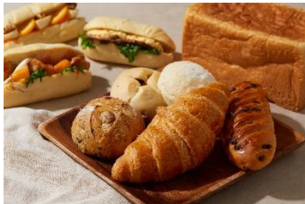
※<メゾン・イチ>のイメージです。