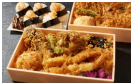
<日本橋 天井 天むす 金子半之助> 惣菜/天丼