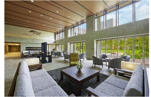
グランクレール世田谷中町のロビー

約5千坪の敷地にシニア住宅176戸、介護住宅75戸。地域多世代交流を目的としたコミュニティサロン「ホームクレール世田谷中町」を設置、趣味や学び等の楽しさを提供しています。