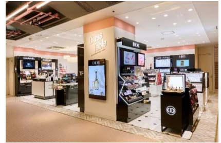
写真左: +Q(プラスク)ビューティー 6階 写真中央: 渋谷ヒカリエ ShinQs 地下1階 写真右: Dress Table by ShinQs ビューティー パレト 1階