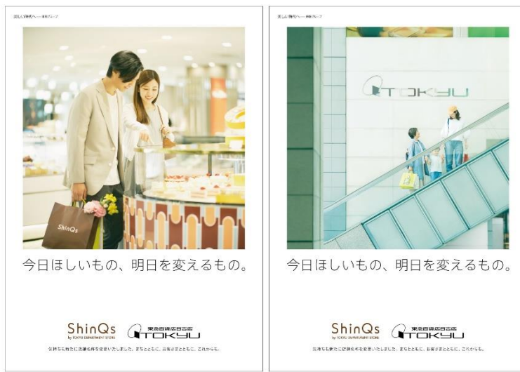
お客さまへの想いを伝える「キャッチコピー」と「キービジュアル」

株式会社東急百貨店（以下、東急百貨店）は、6月11日（木）に「渋谷ヒカリエ ShinQs」を「ShinQs by TOKYU DEPARTMENT STORE」へ、「日吉東急アベニュー」を「東急百貨店 日吉店」へ店舗名称を変更し、百貨店屋号を復活させます。これを機に、両店舗では売場の刷新や記念イベントを順次展開します。