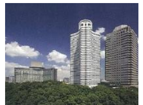
ニューオータニ外観