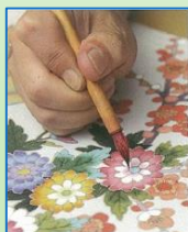
加賀友禪-東京今昔

きものは、長い歴史の中で受け継がれ、育まれてきた世界に誇れる「日本の伝統」です。時代ごとに美しく女性を表現する様々な方法が生まれ、今に伝えられてきました。特選きものをテーマごとにご紹介いたします。