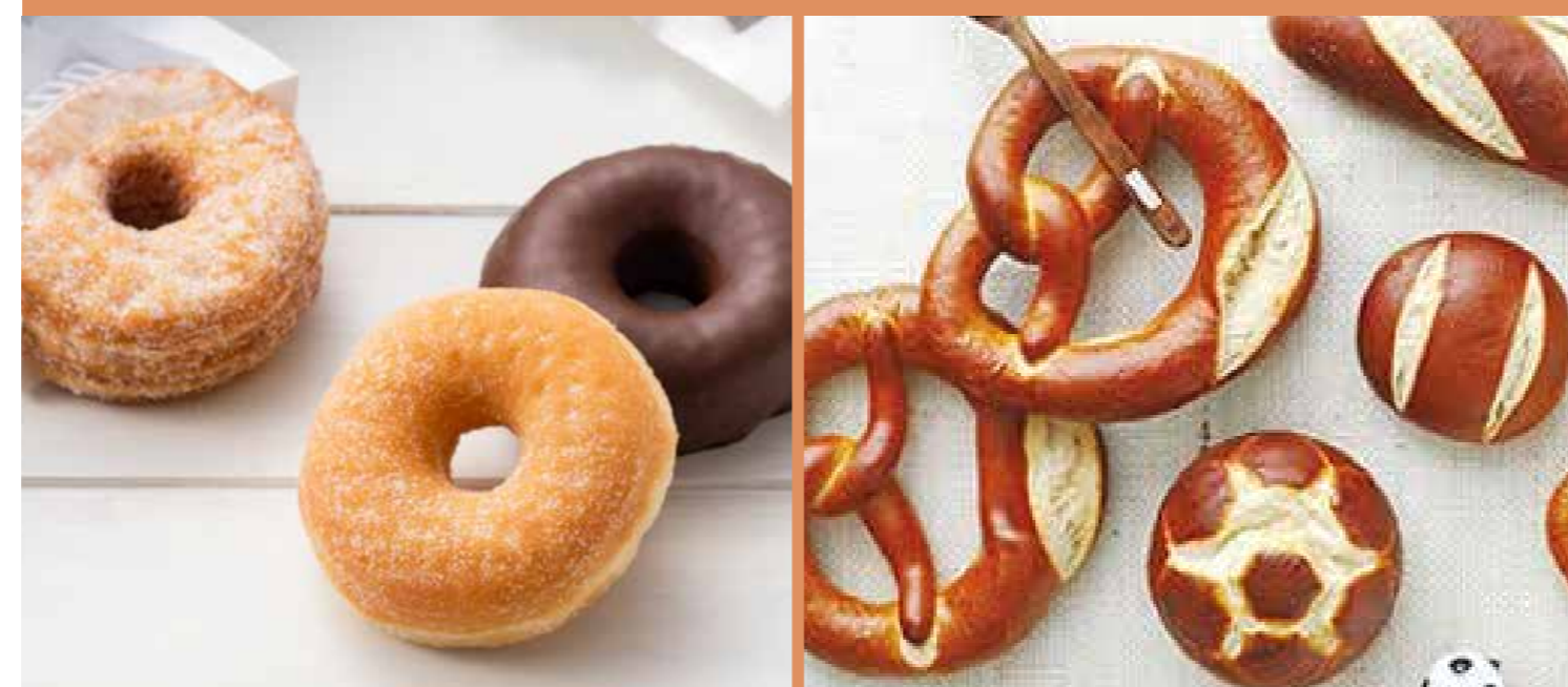
〈LA PANADERIA DOTS〉 輸入ドーナツ