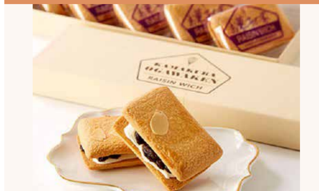
〈鎌倉ウイッチ〉 レーズンサンド