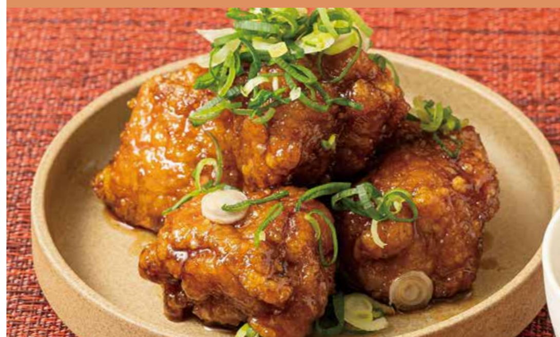
〈とり山卯吉〉 鶏の黒酢南蛮九条ねぎ和え