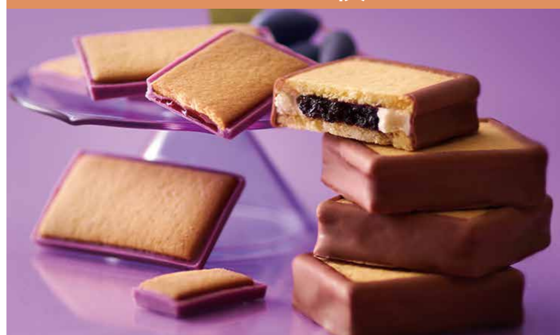
〈morimoto〉 ハスカップジュエリー