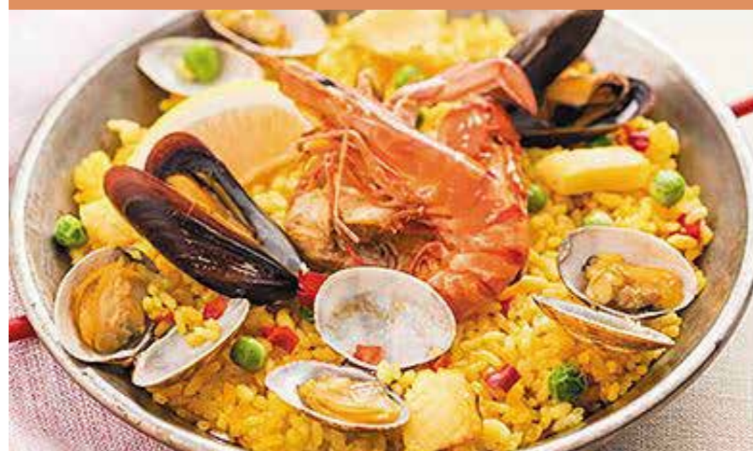
〈スパニッシュココ〉 パエリア