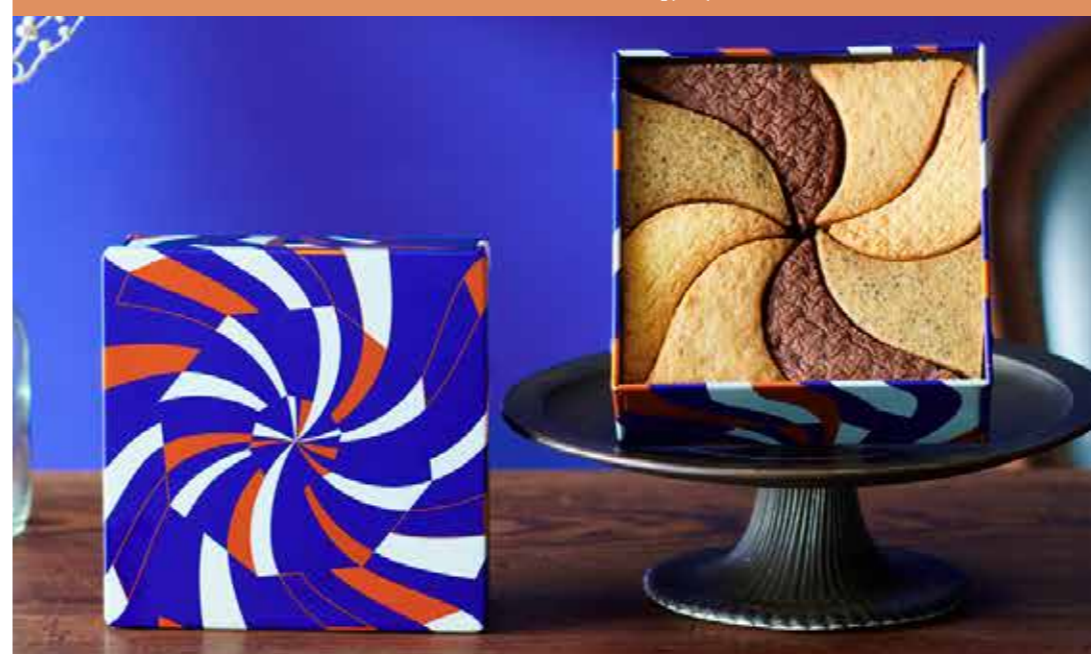
〈架空のパティスリー「しろいし洋菓子店」〉 クッキー缶