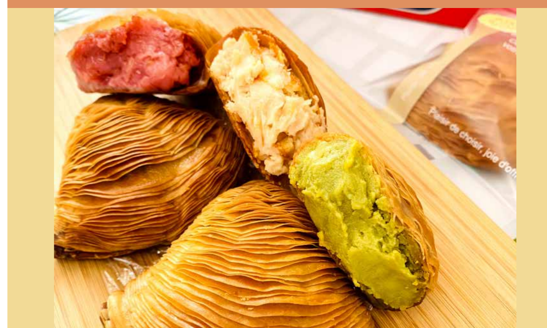
〈オスピターレ〉 スフォリアテッラ