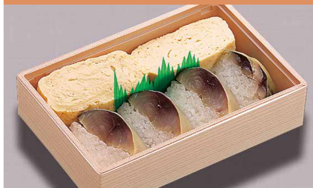
〈大徳寺さいき家〉 京だし巻き弁当