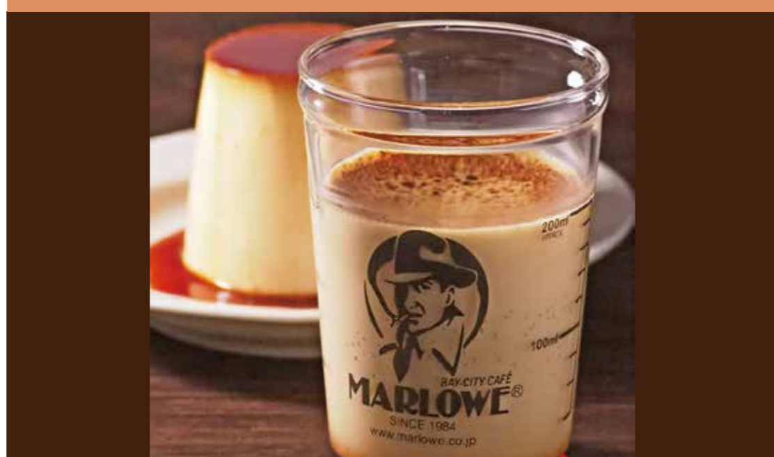
〈マーロウ〉 北海道フレッシュクリームプリン