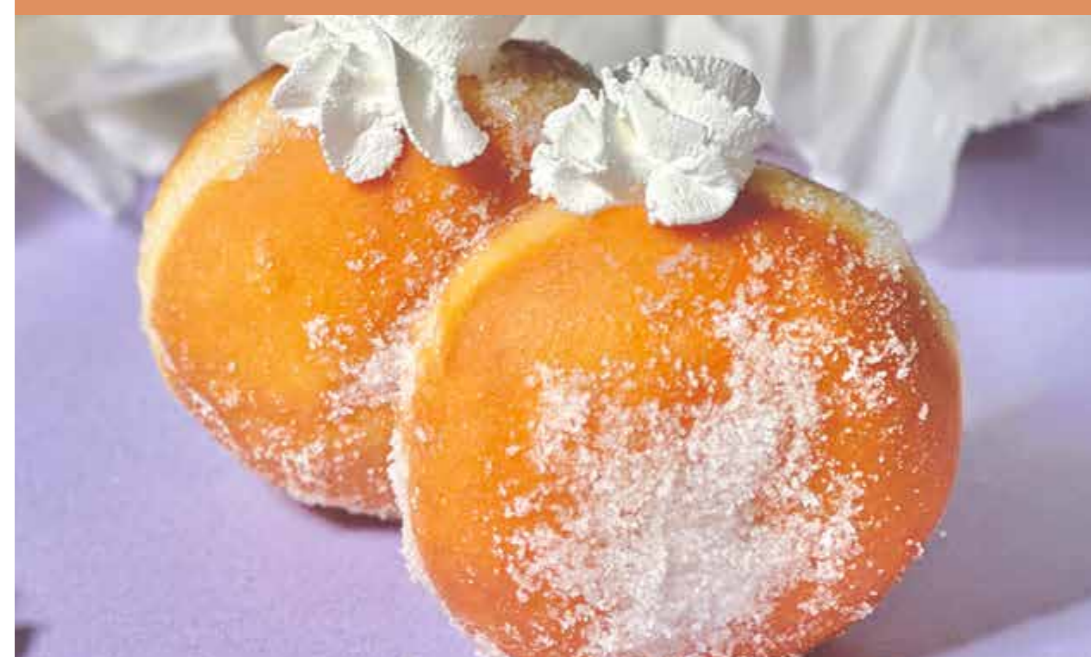
〈RAINBOW PiLea〉 マラサダ