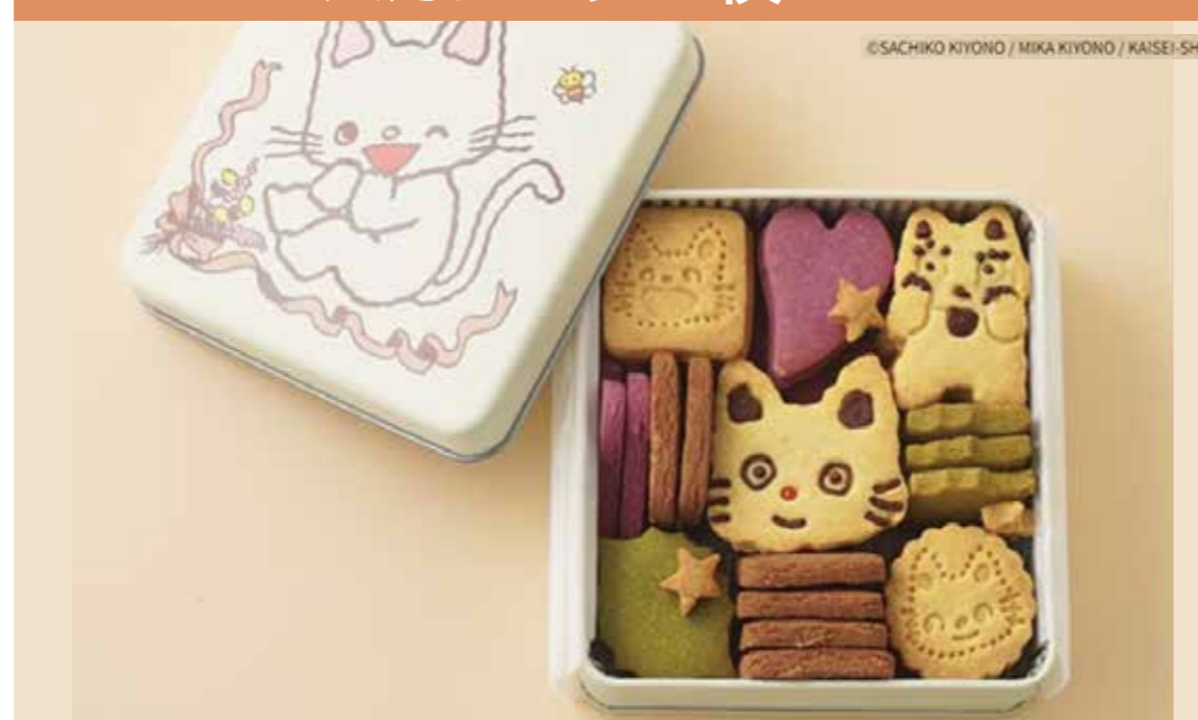
〈名作絵本のクッキー缶セレクション by cake.jp〉 「ノantanのたんじょうび」クッキー缶