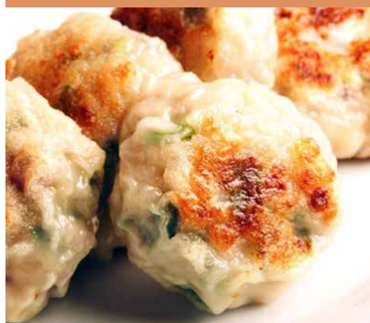
〈上海料理 広華〉 中華点心