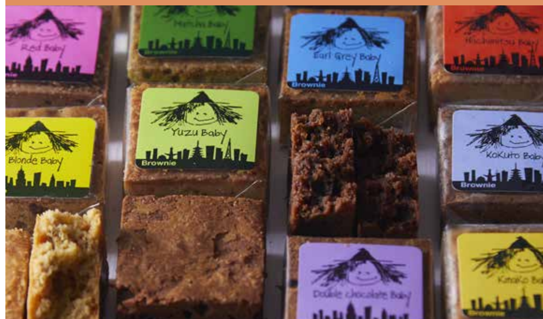
〈Fat Witch New York〉 チョコブラウニー