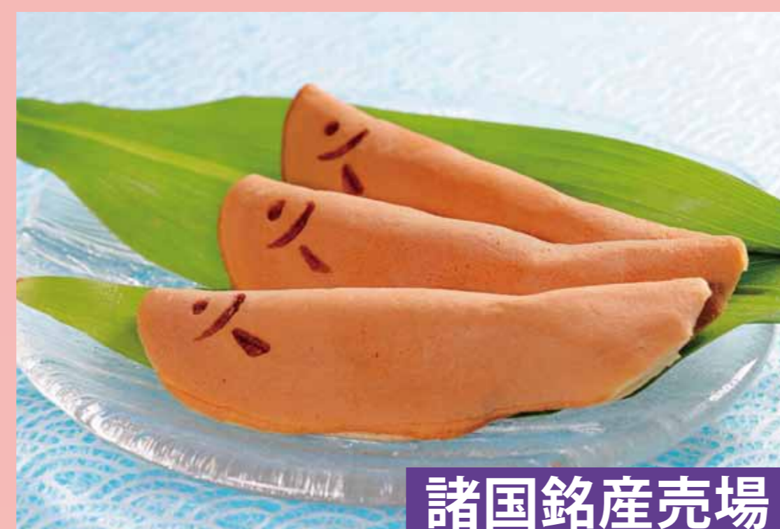
諸国銘産売場 〈風流堂〉 あゆ (1個) ..... 216円