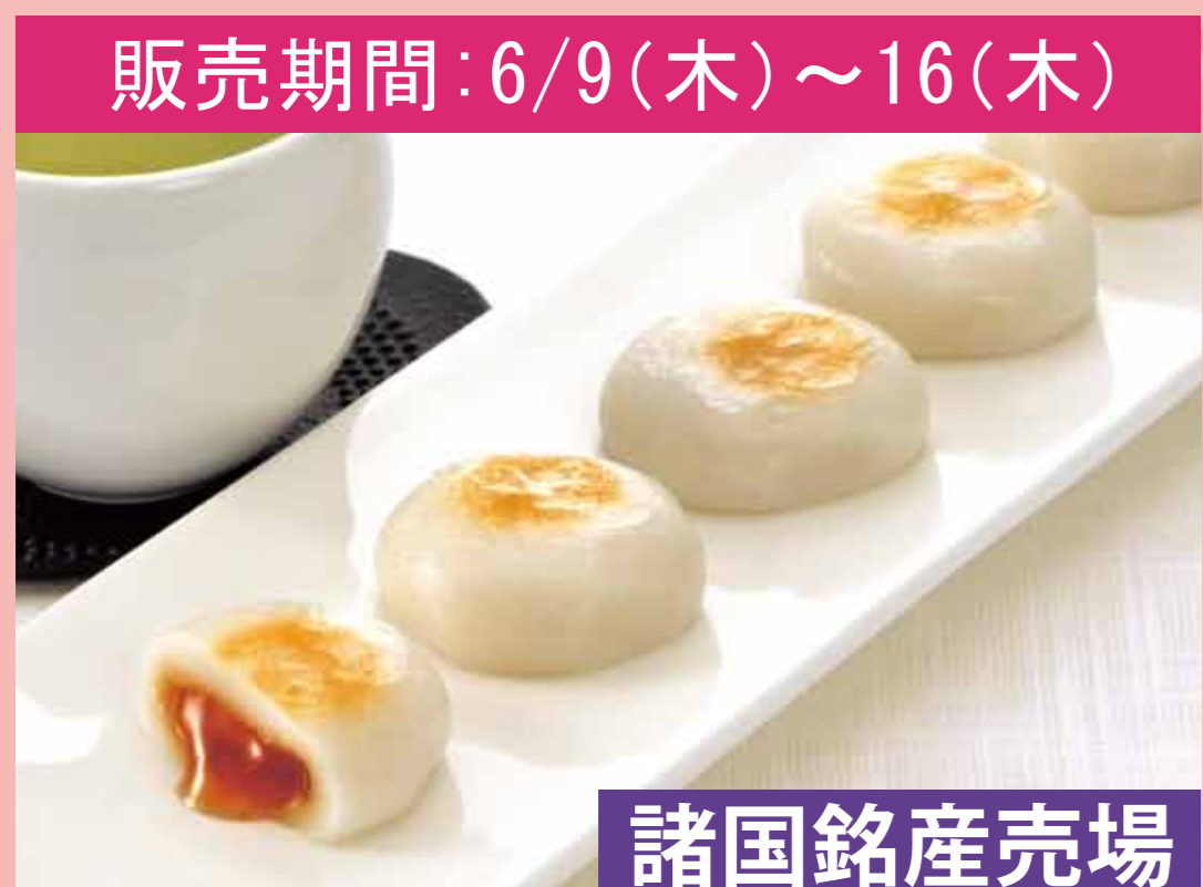
販売期間: 6/9(木)～16(木) 諸国銘産売場 〈寛永堂〉 まるのおみた (12個入) ..... 700円