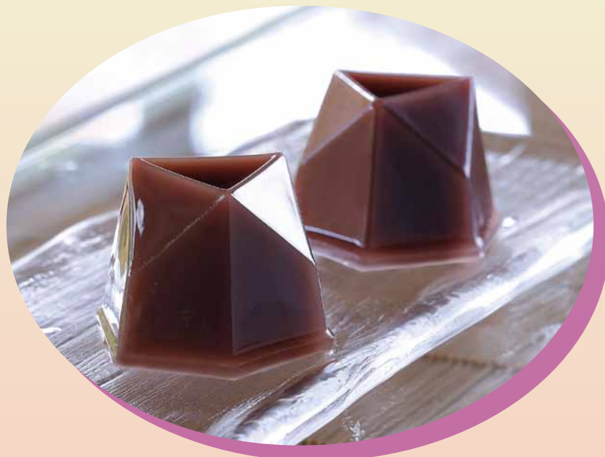
〈叶 匠壽庵〉 水羊羹 (1個) ..... 324円

西暦848年(嘉祥元年)の6月16日、仁明天皇が16個のお菓子をお供えして、疫病を除け健康招福を祈願し、嘉祥の儀式として行いました。この「嘉祥の日」にちなんで1979年に全国和菓子協定が定めたのが「和菓子の日」です。