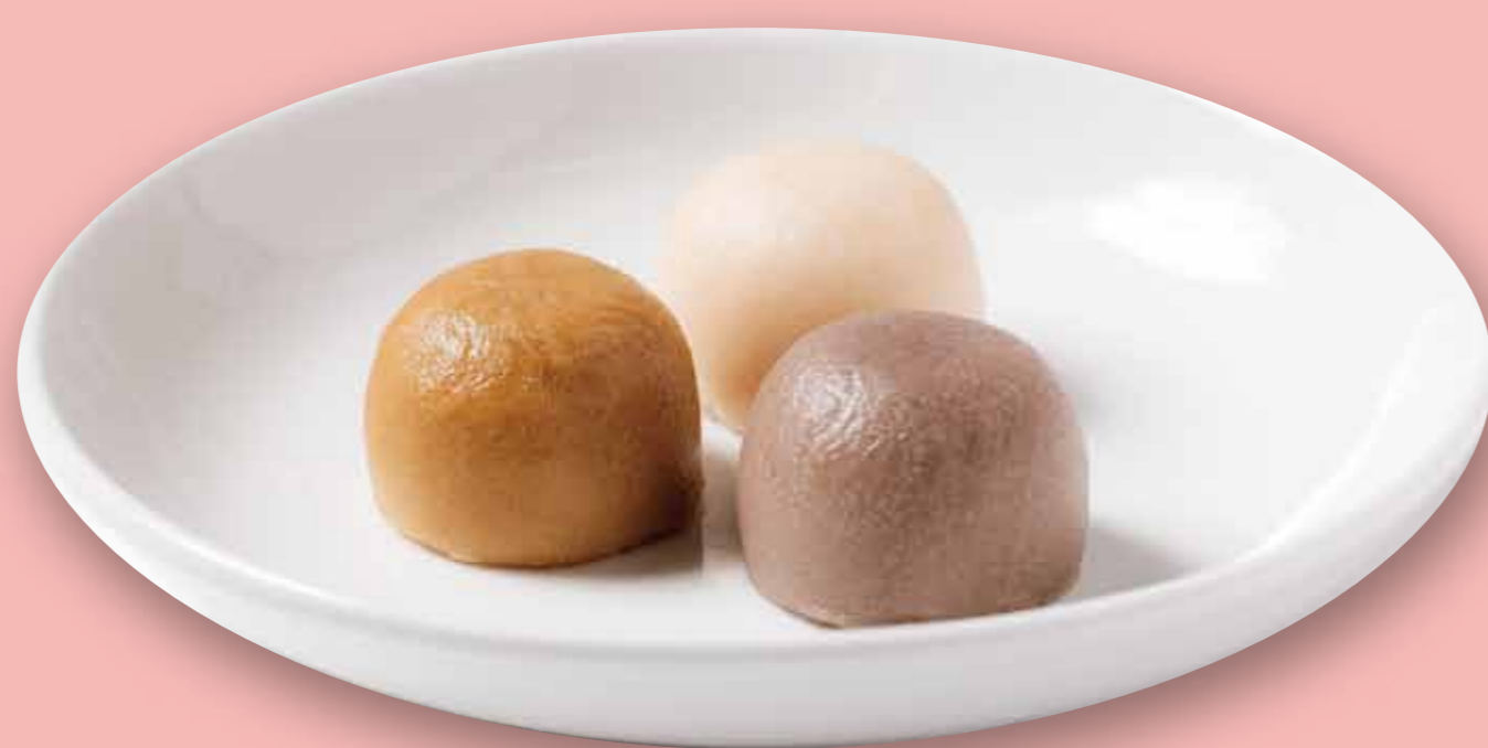
〈山田屋まんじゅう〉 まんじゅう3種バラ詰合せ袋 (1袋・6個入) ..... 713円