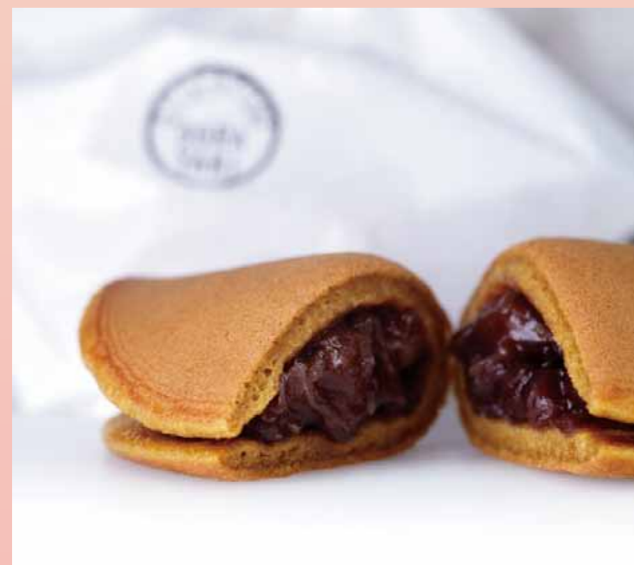
〈黒船〉 黒船どらやき (1個) ..... 233円