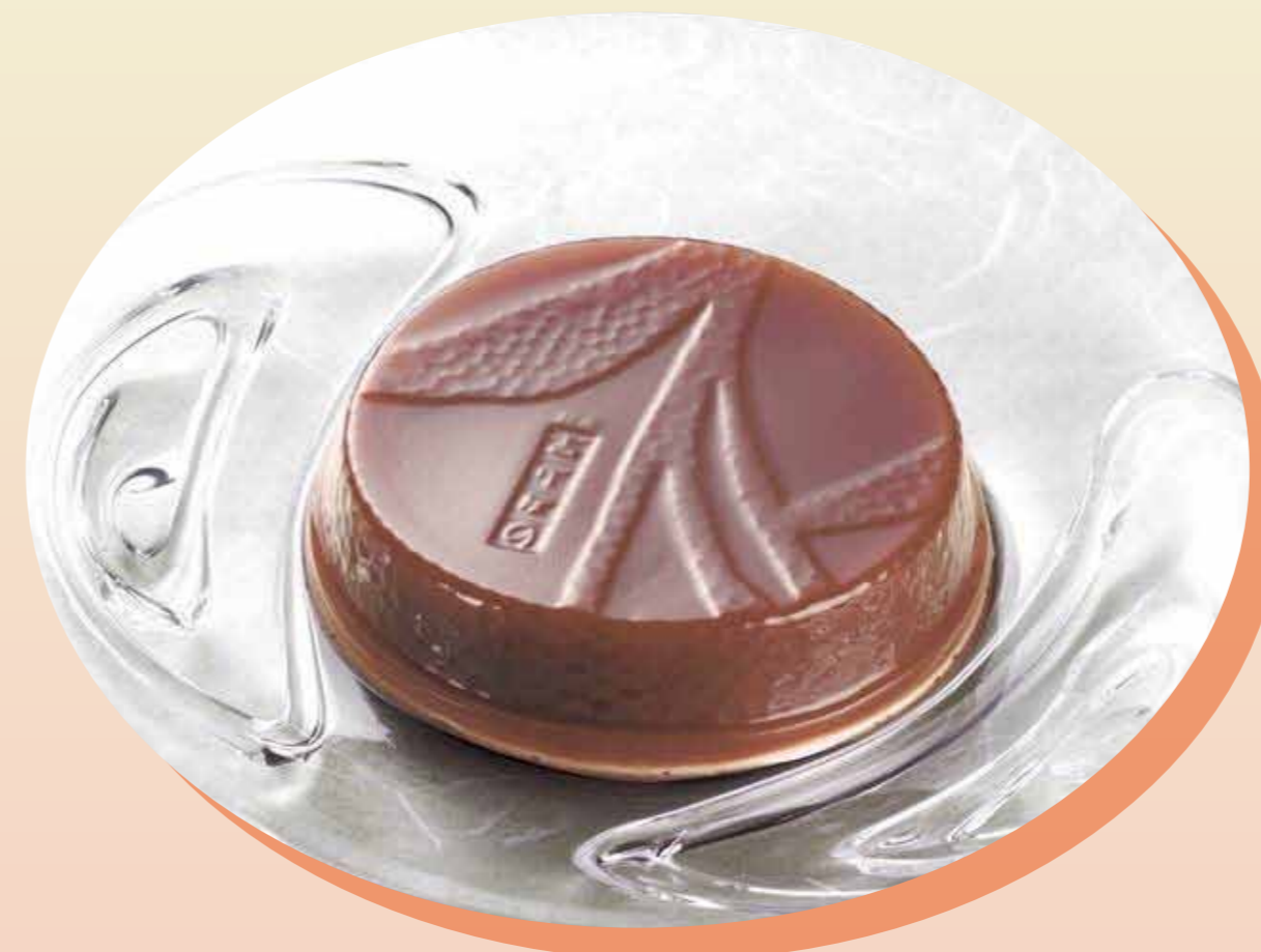
〈銀座あけぼの〉 くちとけ水羊羹 (1個) ..... 324円