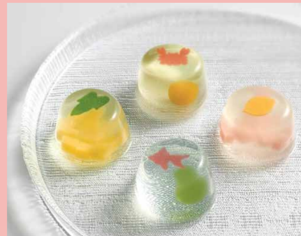
〈笹屋伊織〉 涼の晴風 (各1個) ..... 270円