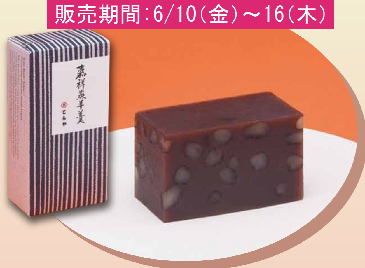
販売期間: 6/10(金)～16(木) 〈とらや〉 嘉祥蒸羊羹 (1本) ..... 2,160円