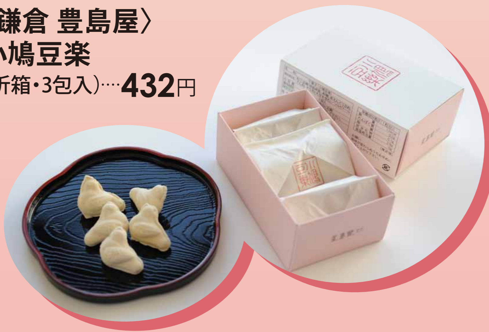
〈鎌倉 豊島屋〉 小鳩豆楽 (折箱・3包入) ..... 432円