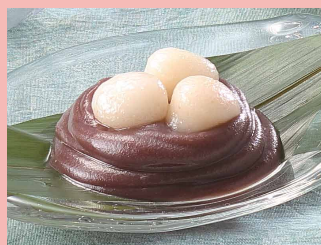
〈宗家 源 吉兆庵〉 冷やしあんとり (1個) ..... 400円