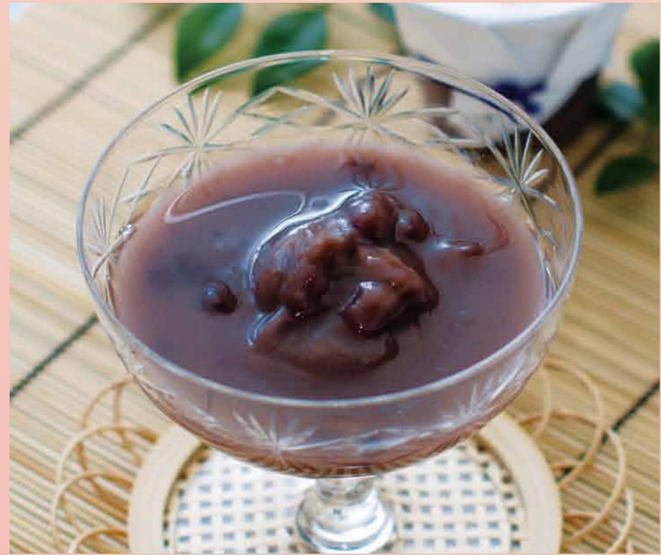
〈日影茶屋〉 冷やししろこ (1個) ..... 411円