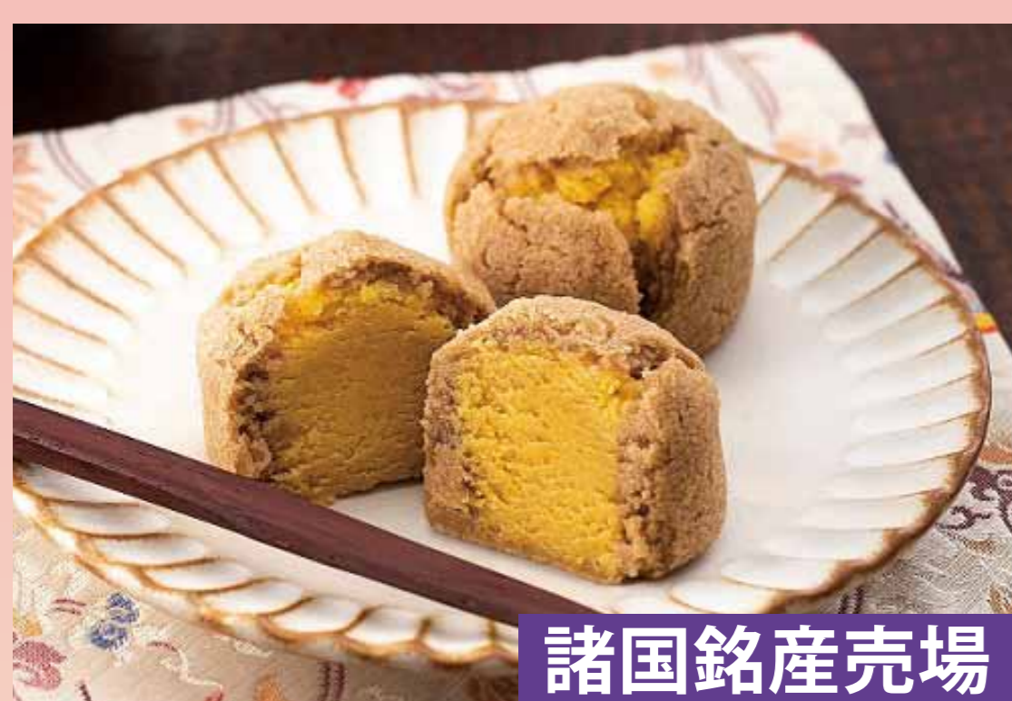
諸国銘産売場 〈清月堂本店〉 おとし文 (4個入) ..... 648円