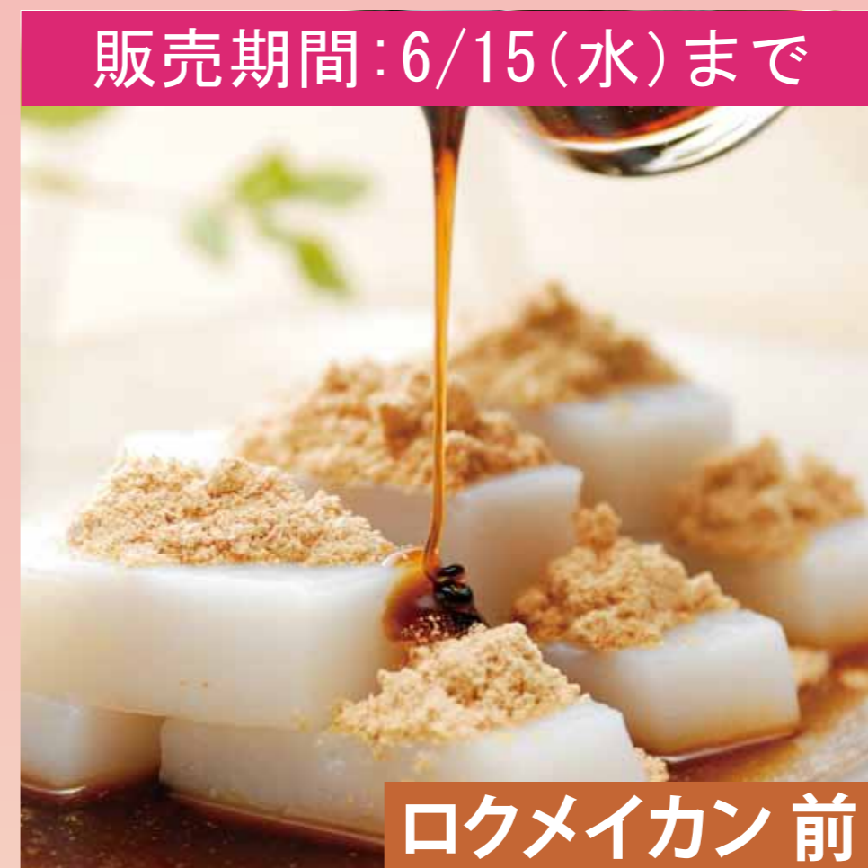
販売期間: 6/15(水)まで ロクメイカン 前 〈船橋屋〉 くず餅 (中箱・36切) ..... 951円