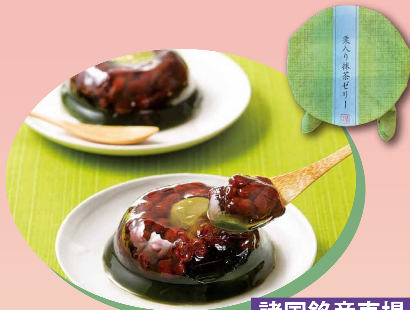
諸国銘産売場 〈清月堂本店〉 栗入り抹茶ゼリー (1個) ..... 432円